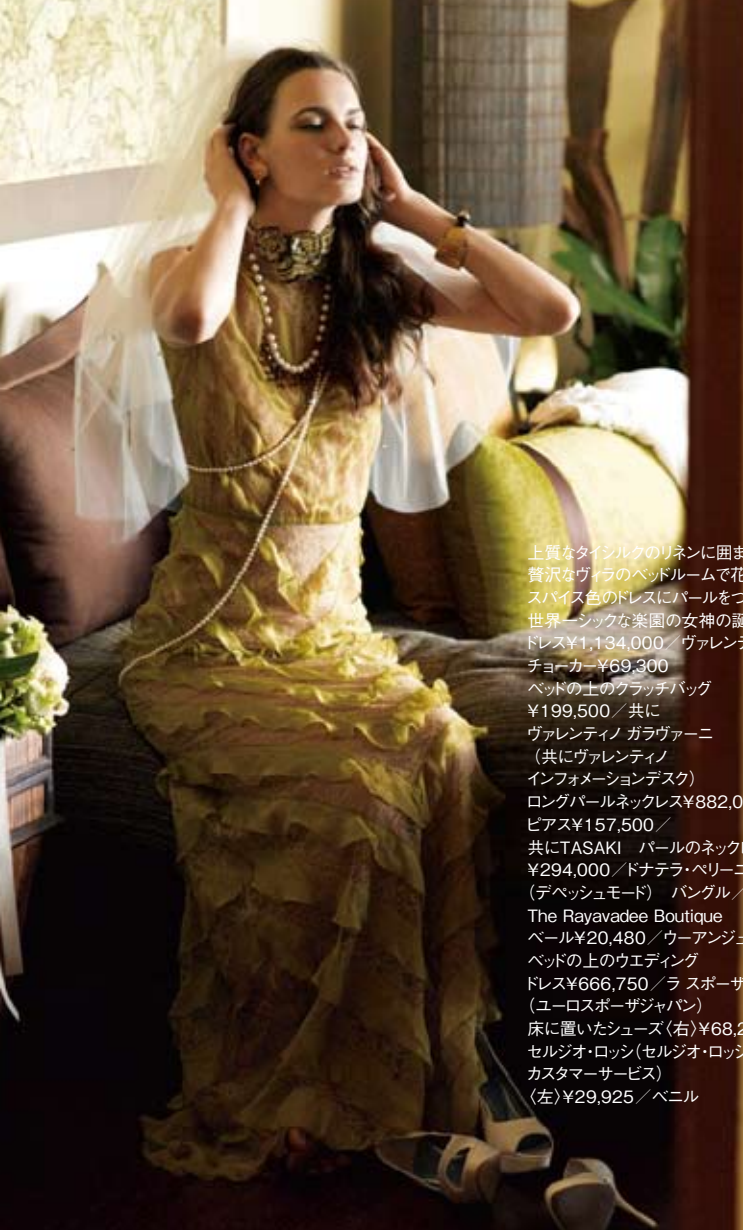
上質なタイシルクのリネンに囲まれた贅沢なヴァラのベッドルームで花嫁支度。スパイス色のドレスにパールをつけたら世界一シックな楽園の女神の誕生。ドレス¥1,134,000 / ヴァレンティノ チョーカー ¥69,300 / ベッド上のクラッチバッグ ¥199,500 / 共に ヴァレンティノ ガラヴァーニ (共にヴァレンティノ インフォメーションデスク) / ロングパールネックレス ¥882,000 / ピアス ¥157,500 / 共にTASAKI パールのネックレス ¥294,000 / ドナテラ・ペリーニ (デベッシュモード) / バンゲル / The Rayavadee Boutique / ベール ¥20,480 / ウーアンジュ ベッド上のウエディングドレス ¥666,750 / ラスポーザ (ユーロスポーザジャパン) / 床に置いたシューズ(右) ¥68,250 / セルジオ・ロッシ(セルジオ・ロッシカスタマーサービス) (左) ¥29,925 / ベニル