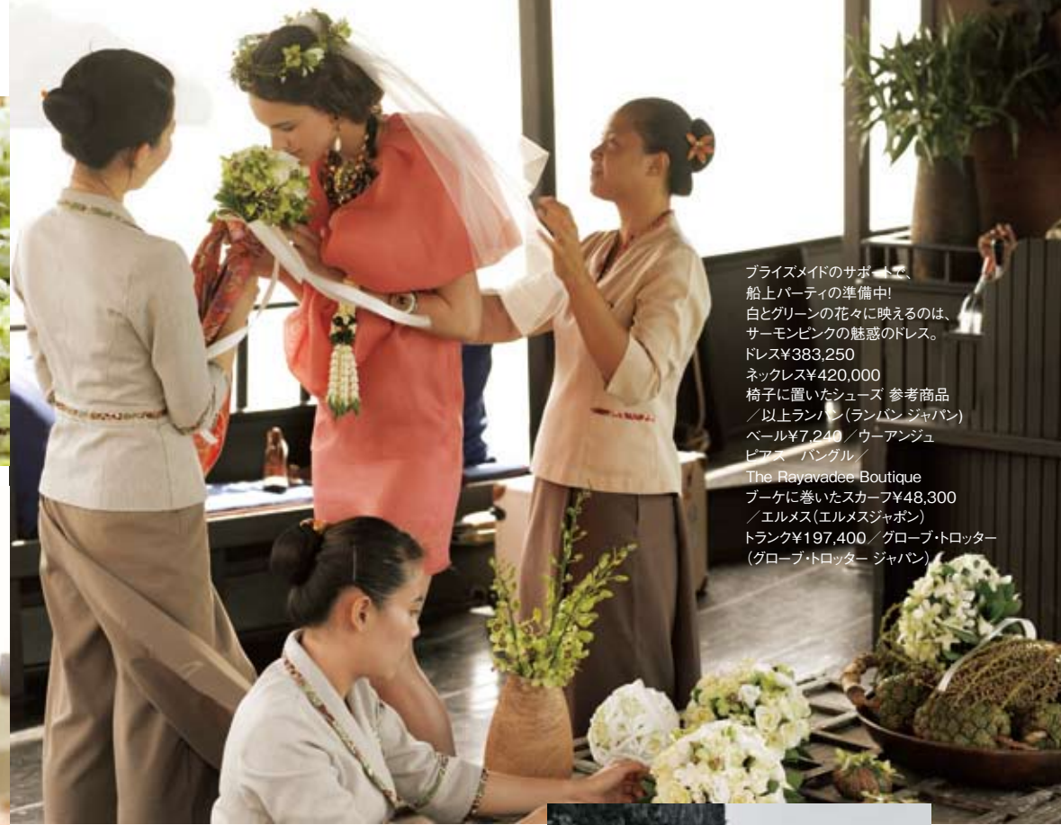
ブライズメイドのサポートで、船上パーティの準備中! 白とグリーンの花々に映えるのは、サーモンピンクの魅惑のドレス。ドレス¥383,250 / ネックレス¥420,000 / 椅子に置いたジュース 参考商品 / 以上ランバン(ランバンジャパン) / ベール¥7,240 / ウーアンジュ ピアス / バンゲル / The Rayavadee Boutique / ブーケに巻いたスカーフ¥48,300 / エルメス(エルメスジャパン) / トランク¥197,400 / グローブ・トロッター (グローブ・トロッター ジャパン)