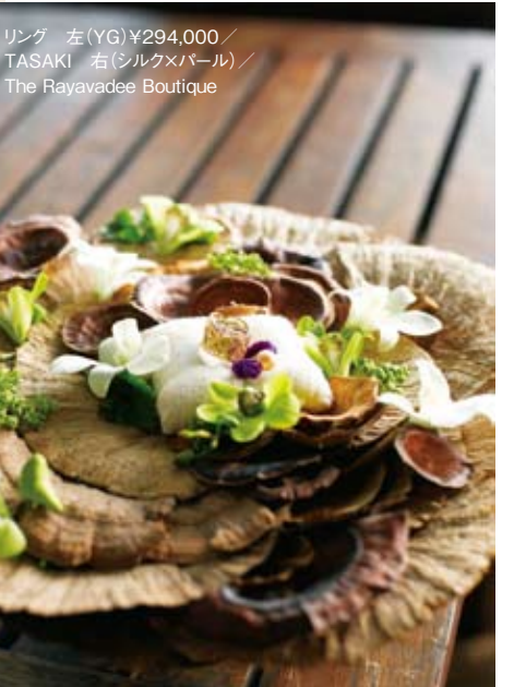
リング 左(YG) ¥294,000 / TASAKI 右(シルクメパール) / The Rayavadee Boutique